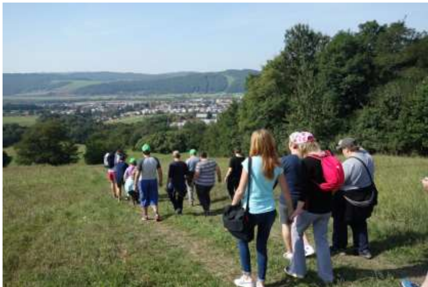
Túra pri dvojkríži