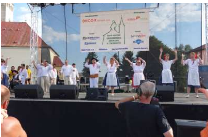
Výstúpenie na Stropkovskom jarmoku